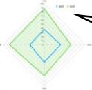
レーダーチャート